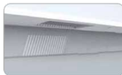
Struttura integrata in una copertura preesistente